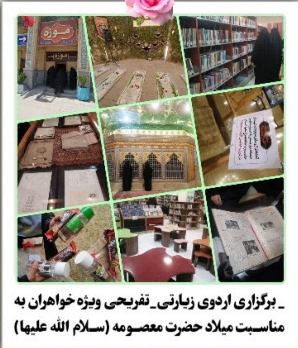
برگزاری اردوی زیارتی-تفریحی ویژه خواهران به مناسبت میلاد حضرت معصومه (سلام الله علیها)