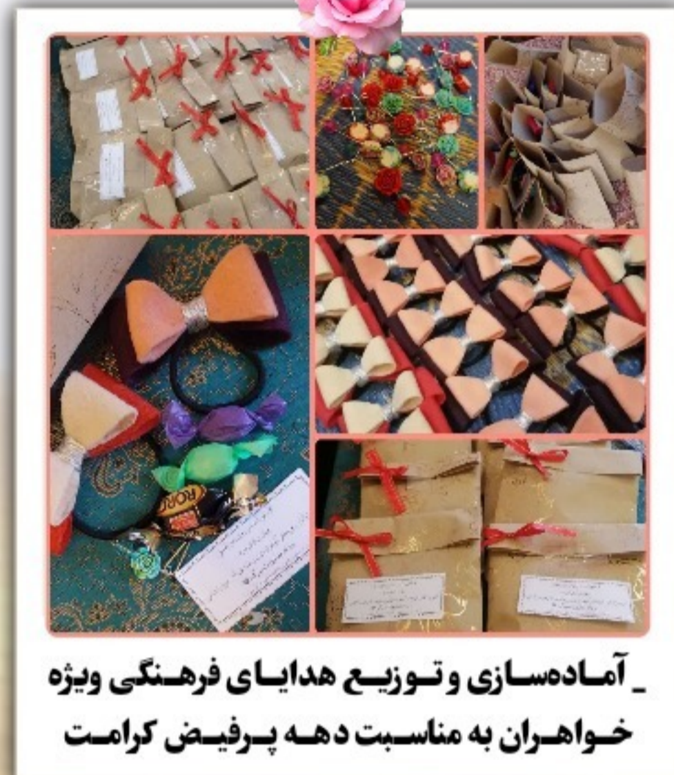
آماده‌سازی و توزیع هدایای فرهنگی ویژه خواهران به مناسبت دهه پرفیض کرامت