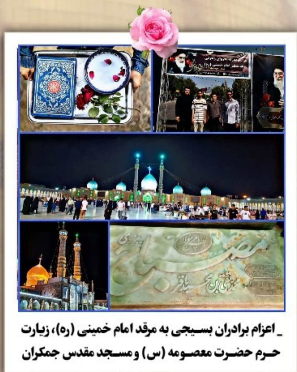
اعزام برادران بسیجی به مرقد امام خمینی (ره)، زیارت حرم حضرت معصومه (س) و مسجد مقدس جمکران