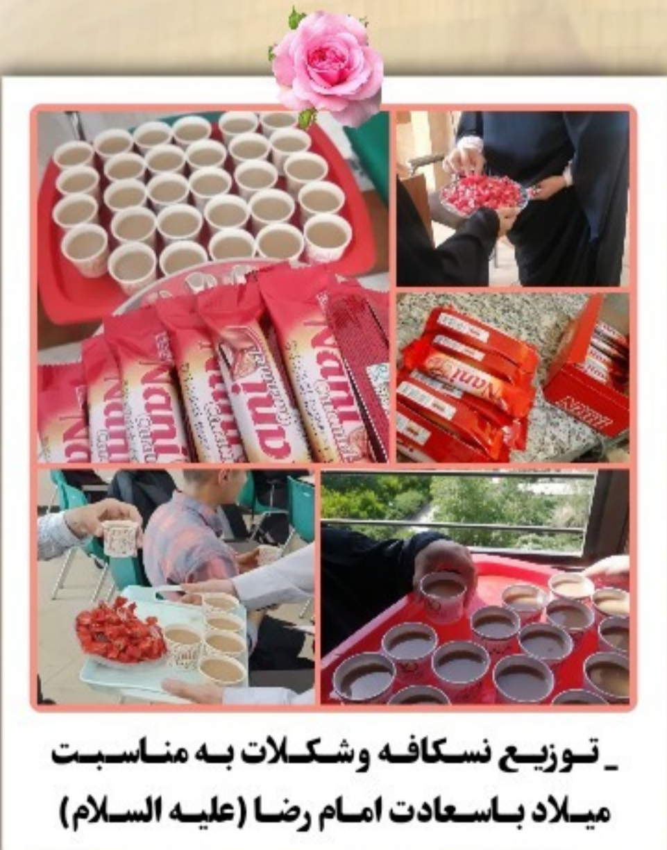
توزیع نسکافه و شکلات به مناسبت میلاد باسعادت امام رضا (علیه السلام)